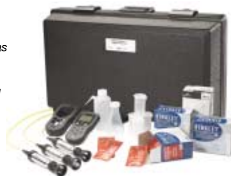
Kit de campo avanzado reforzado para OD/pH/Conductividad