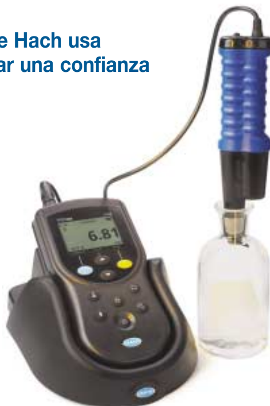
Para usar con botellas de DBO de 300 mL, N° de producto 2943100.

La EPA recomienda el Método LDO® 10360 de Hach para utilizarlo en el monitoreo que cumpla con las normas.*