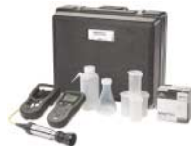
Kit de campo reforzado para OD