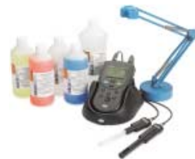
Paquete avanzado para pH/conductividad

Vea en las páginas 92-95 más información.