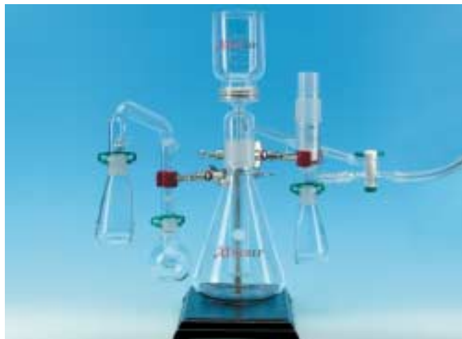
La base y la abrazadera para laboratorio se venden por separado.

Nº de producto Descripción 2943232 Kit de tubos múltiples de 3 lugares, piezas de vidrio 2946707 Tubos múltiples de 3 lugares, acero inoxidable