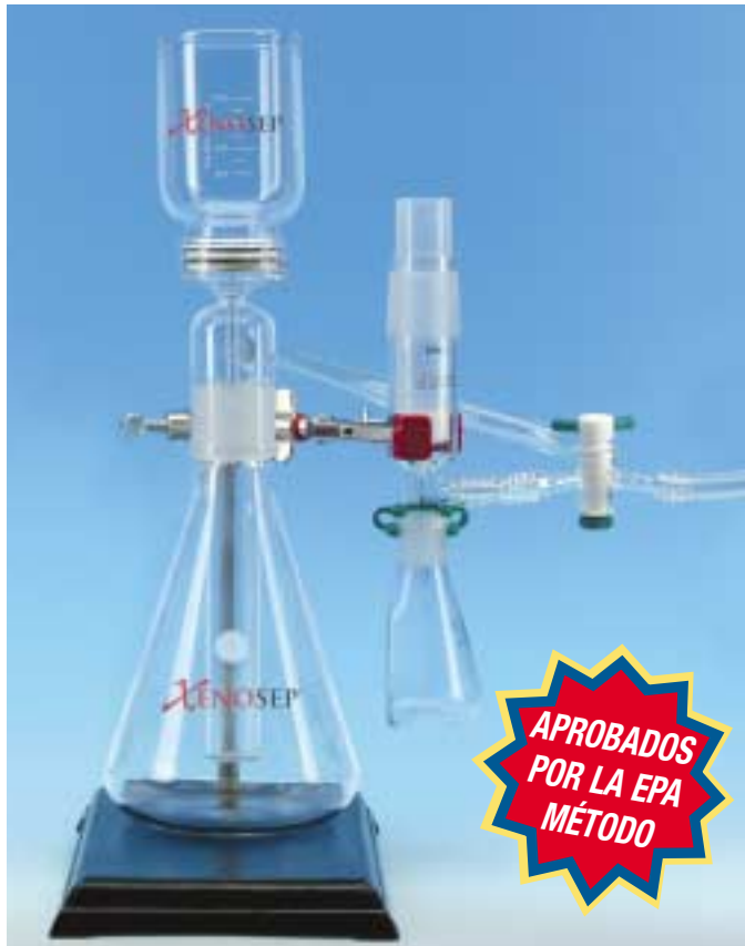
La base y la abrazadera para laboratorio se venden por separado.

¡Por fin, un método fácil y aprobado por la EPA para aceite y grasa!