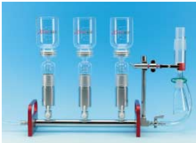
El tubo múltiple se vende por separado.

¿Necesita capacidad para procesar varias muestras o para recuperar el disolvente?