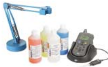
Kit inicial para pH