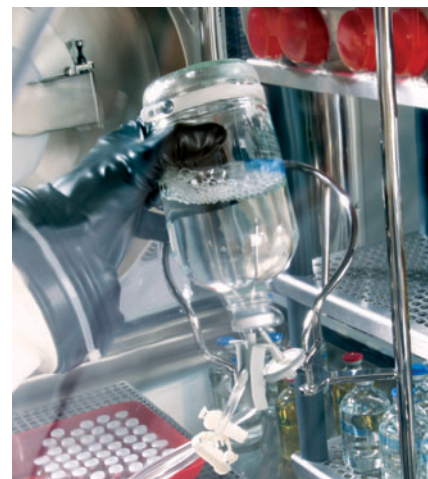
La barra soporte para las muestras es desmontable y puede sostener viales o bolsas de plástico desde 100 ml a 1,5 l.

En el modo automático, el analista sólo necesita seleccionar en el panel de control el SOP apropiado para la muestra a analizar. El sistema Steritest Equinox guiará al analista en cada paso, actuando como una guía formativa, y respaldando de este modo las buenas prácticas de fabricación. Los diversos pasos del procedimiento, la velocidad